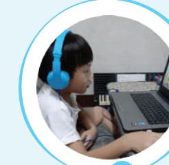
น้องคุณ นักเรียน Winner English Level 2

“ น้องสนุกกับการเรียนภาษาอังกฤษกับ Winner English มากค่ะ โปรแกรมทันสมัย เรียนเข้าใจง่าย มีบทเรียนและแบบฝึกหัดหลากหลาย ตอบโจทย์การเรียนรู้ของเด็กๆ ยุคนี้มากค่ะ ช่วยให้น้องมีพื้นฐานภาษาอังกฤษนำไปใช้สอบได้ดีค่ะ ”